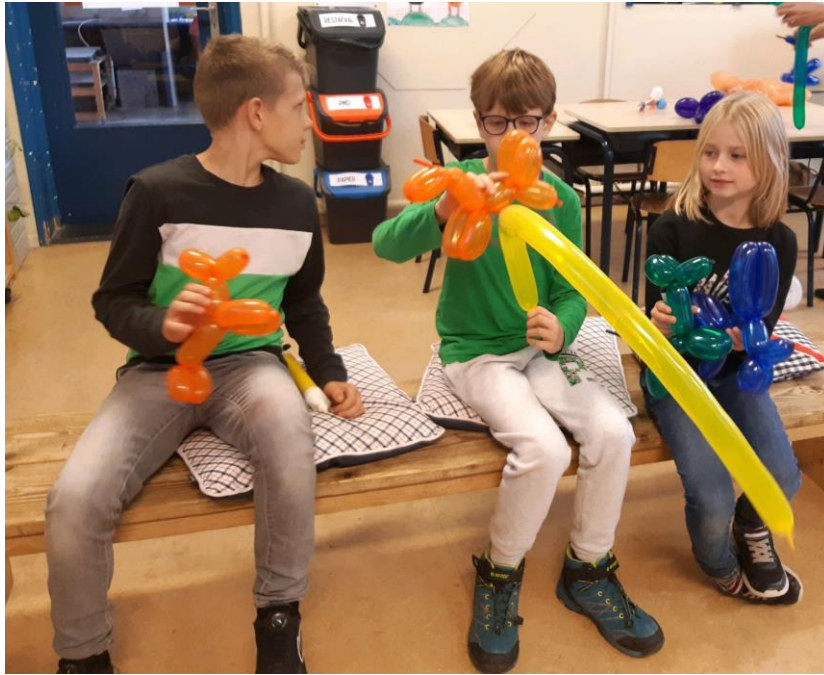
enkele foto's van de keuzecursus